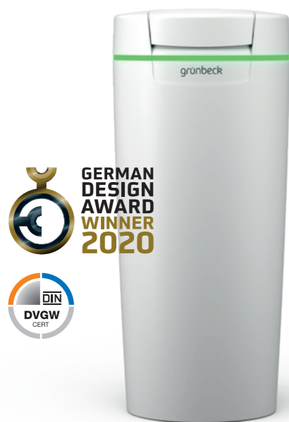
Impianto di addolcimento softliQ:SD

Con i nuovi impianti softliQ è possibile sfruttare un'intera gamma di servizi. Tutte le misure sono dotate del nuovo display touch. Ciò garantisce un utilizzo comodo e intuitivo. L'impianto pensa in anticipo per voi: tramite la fotocellula a infrarossi softliQ misura il livello di riempimento del sale e vi ricorda tempestivamente quando è necessario ricaricare. Tramite display, tramite l'app Grünbeck myProduct e, se si desidera, tramite e-mail, rimarrete informati in qualsiasi momento. Il sensore acqua integrato, che monitora eventuali perdite d'acqua incontrollate nel luogo di installazione del dispositivo, offre un'ulteriore sicurezza per la vostra casa.