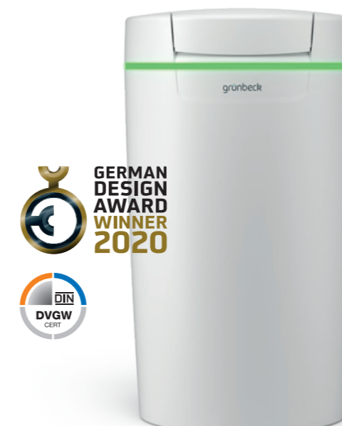
Impianto di addolcimento softliQ:MD